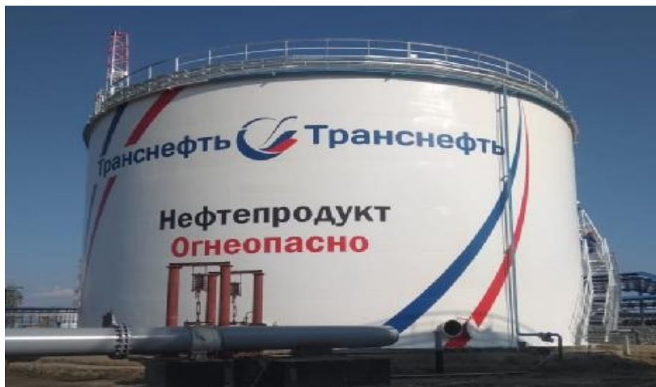
Рисунок 4 – Общий вид резервуаров РВС-5000 зав.№№ 105, 106

Пломбирование резервуаров вертикальных стальных цилиндрических РВСП-20000, РВС-20000, РВС-10000, РВС-5000 не предусмотрено.