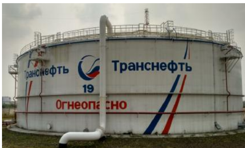
Рисунок 2 – Общий вид резервуара РВС-20000 зав.№ 19