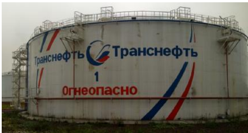
Рисунок 1 – Общий вид резервуара РВСП-20000 зав.№ 1

Общий вид резервуаров вертикальных стальных цилиндрических РВСП-20000 зав.№ 1, РВС-20000 зав.№ 19, РВС-10000 зав.№№ 9, 10, 11, 12, РВС-5000 зав.№№ 105, 106 представлен на рисунках 1 - 4.