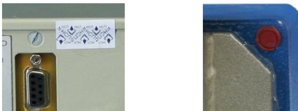
Рисунок 3 - Места пломбирования влагомера МВН-1

Модификации и исполнения влагомера приведены в таблице 1.