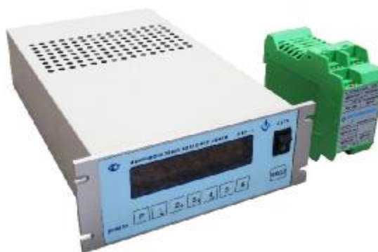
Рисунок 2 - Блок обработки влагомера МВН-2. Щитовой вариант (слева) и вариант на DIN рейку (справа)