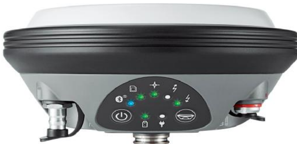
Рисунок 1 - Общий вид аппаратуры геодезической спутниковой Leica GS16 RUS.