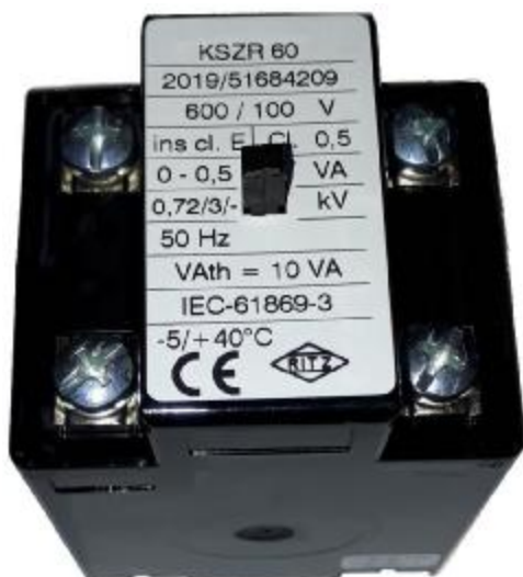
Рисунок 8 – Общий вид трансформаторов напряжения KSZR 60