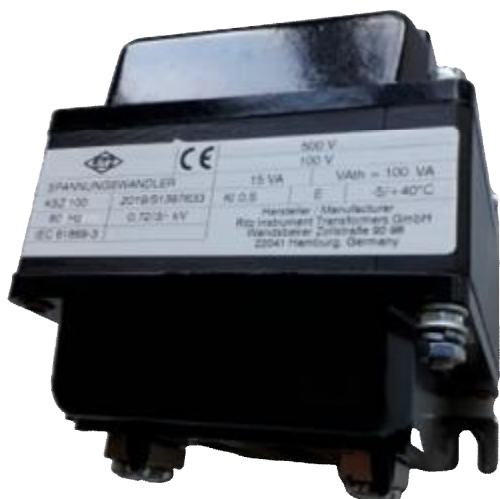
Рисунок 6 – Общий вид трансформаторов напряжения KSZ 100