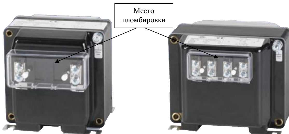
Рисунок 2 – Общий вид трансформаторов напряжения KSE 100