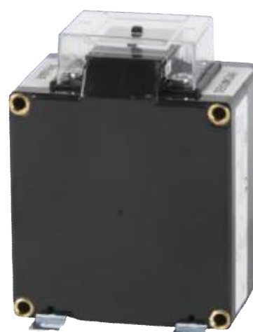
Рисунок 5 – Общий вид трансформаторов напряжения KSER 104