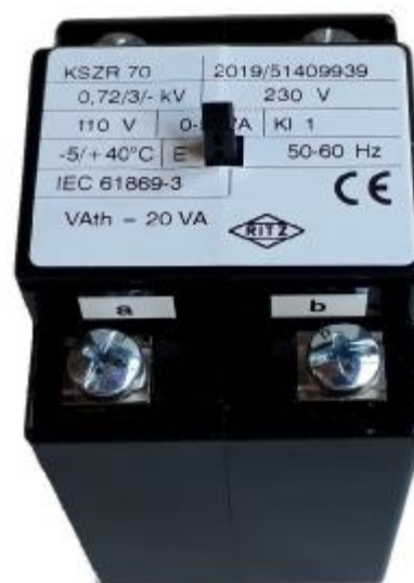
Рисунок 9 – Общий вид трансформаторов напряжения KSZR 70