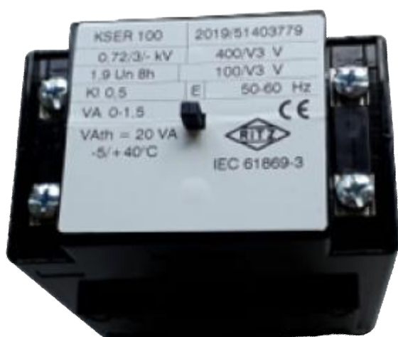
Рисунок 4 – Общий вид трансформаторов напряжения KSER 100