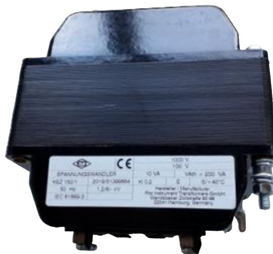
Рисунок 7 – Общий вид трансформаторов напряжения KSZ 150