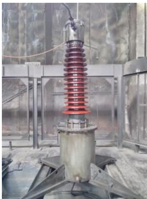
Рисунок 1 - Общий вид средства

Общий вид средства измерений и место пломбировки от несанкционированного доступа представлен на рисунках 1 и 2.