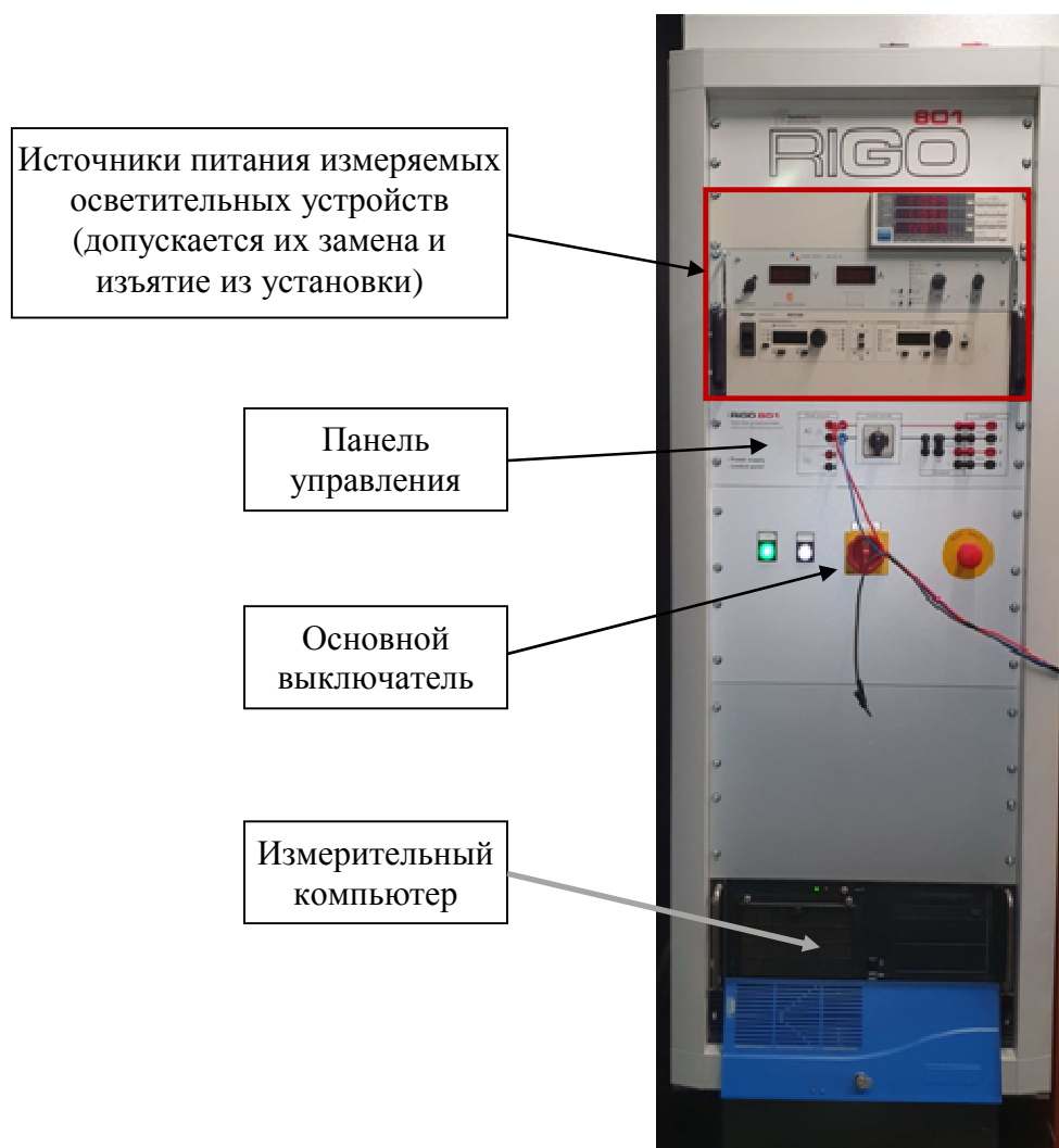
Рисунок 2 – Общий вид электрического шкафа управления гониофотометром