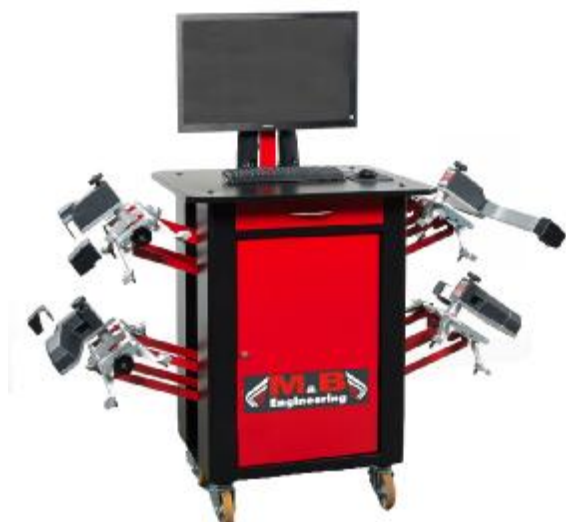
Рисунок 1 - Общий вид устройств для измерений углов установки колес автомобилей, модели SNIPER WA80