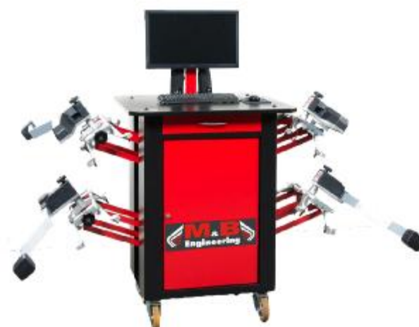
Рисунок 2 - Общий вид устройств для измерений углов установки колес автомобилей, модели SNIPER WA80 TRUCK