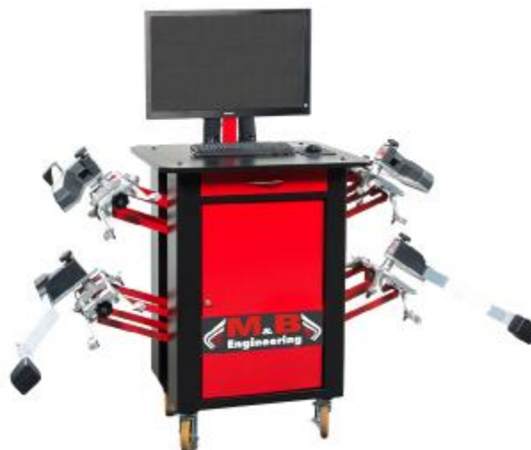
Рисунок 3 - Общий вид устройств для измерений углов установки колес автомобилей, модели SNIPER WA85