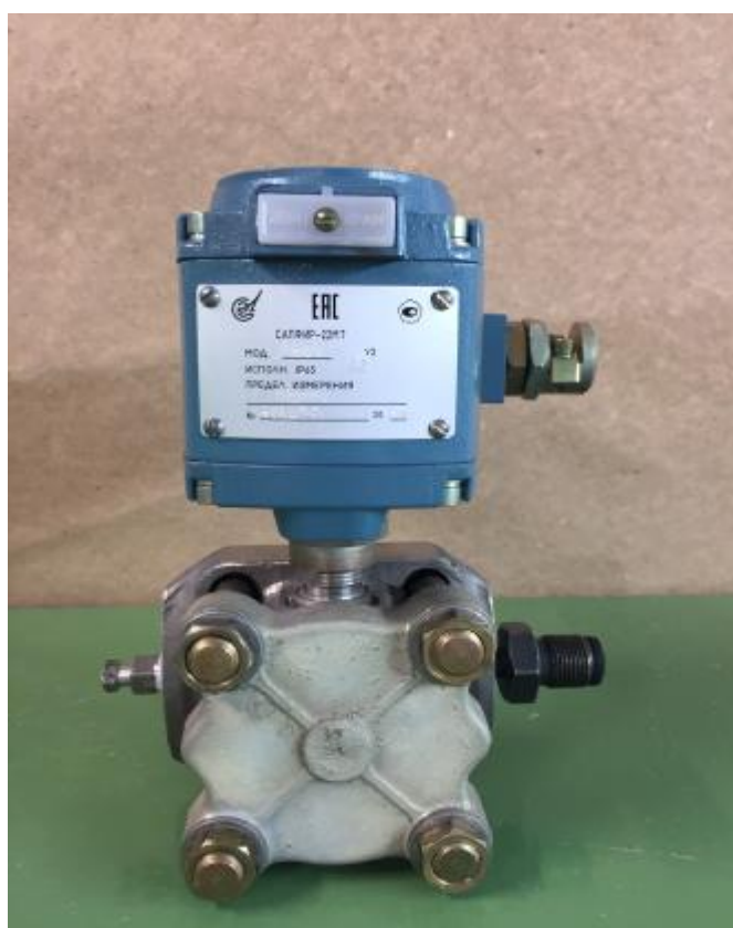
Рисунок 2 - Общий вид преобразователей измерительных Сапфир 22МТ