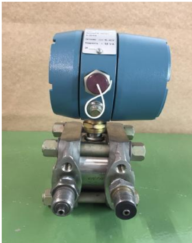
Рисунок 1 - Общий вид преобразователей измерительных Сапфир 22М и Сапфир-22-Ех-М

Общий вид преобразователей измерительных Сапфир-22М и Сапфир-22-Ех-М представлен на рисунке 1. Общий вид преобразователей измерительных Сапфир-22МТ представлен на рисунке 2. Конструкция преобразователей измерительных предусматривает защиту доступа к электронному блоку путем пломбирования. Место нанесения пломбы на преобразователи измерительные показано на рисунке 3.