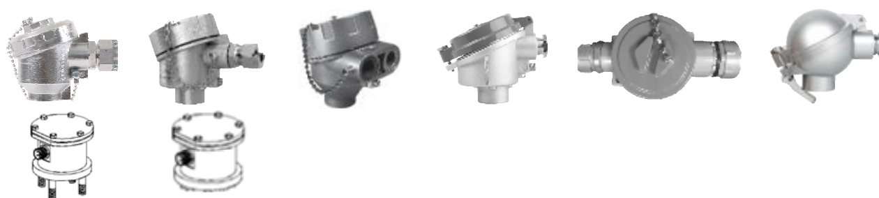
Рисунок 4 - Общий вид конструктивных исполнений головок ТПУ-205