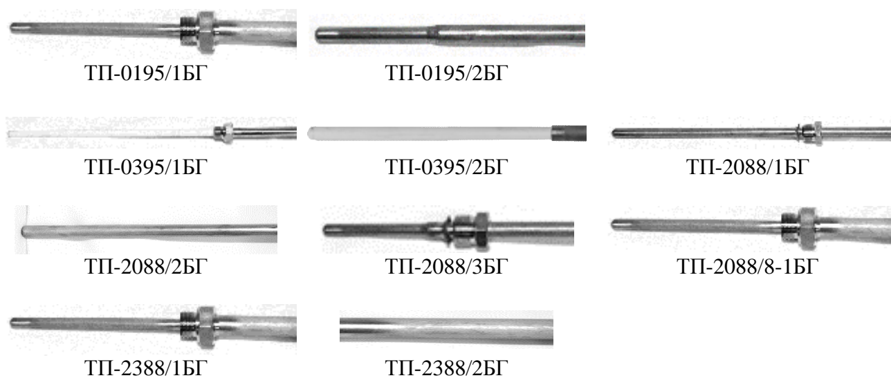
Рисунок 3 - Общий вид первичных преобразователей ТП