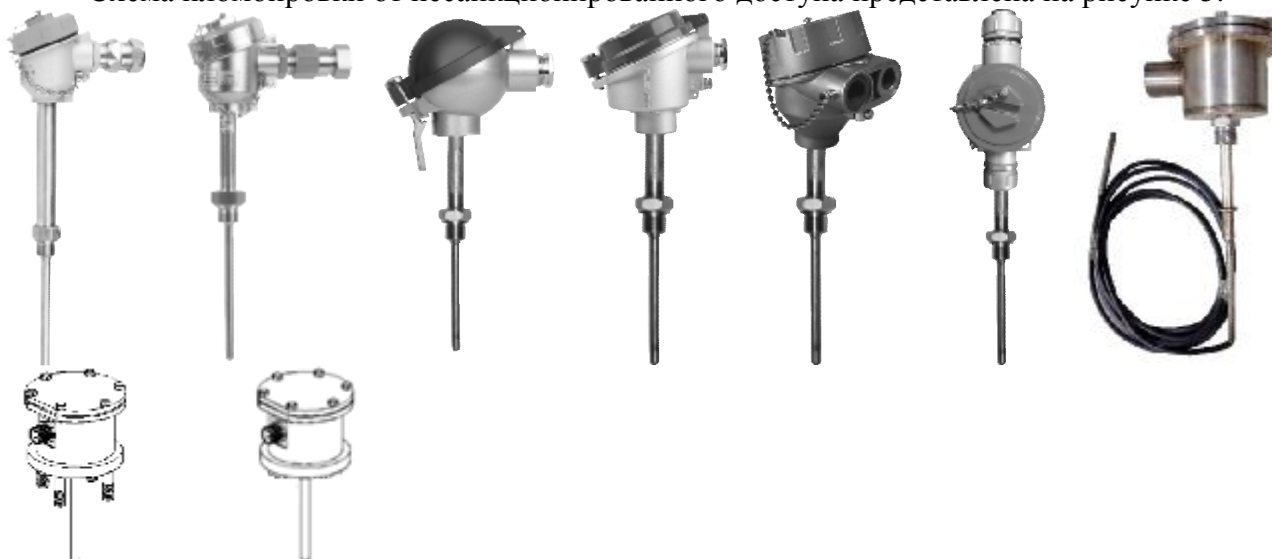
Рисунок 1 - Общий вид термопреобразователей с унифицированным выходным сигналом ТПУ-205

Схема пломбировки от несанкционированного доступа представлена на рисунке 5.