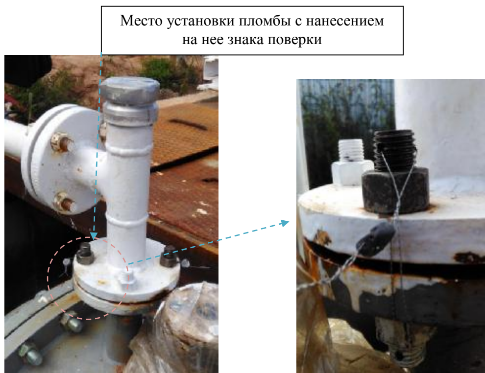
Рисунок 2 – Схема пломбировки от несанкционированного доступа, обозначение мест нанесения знака поверки и пломбы завода-изготовителя