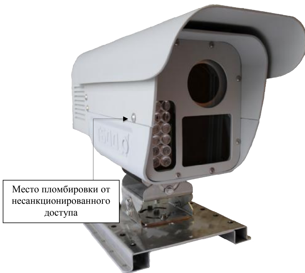
Рисунок 3 – Общий вид комплексов в исполнениях 02 и 03