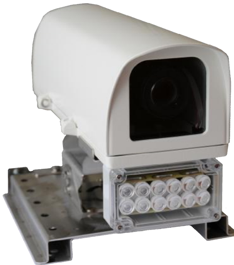
Рисунок 1 – Общий вид ТВ датчика комплексов в исполнении 01