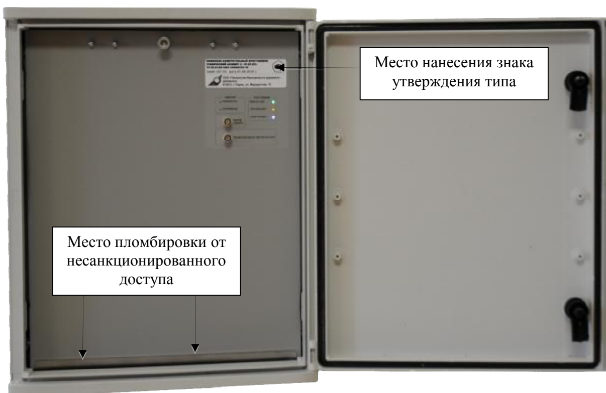
Рисунок 2 – Общий вид вычислительного модуля комплексов в исполнении 01