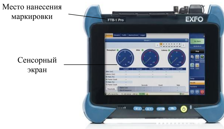
Рисунок 1 – Общий вид систем

Схема пломбировки от несанкционированного доступа, обозначение места нанесения знака поверки представлены на рисунке 2.