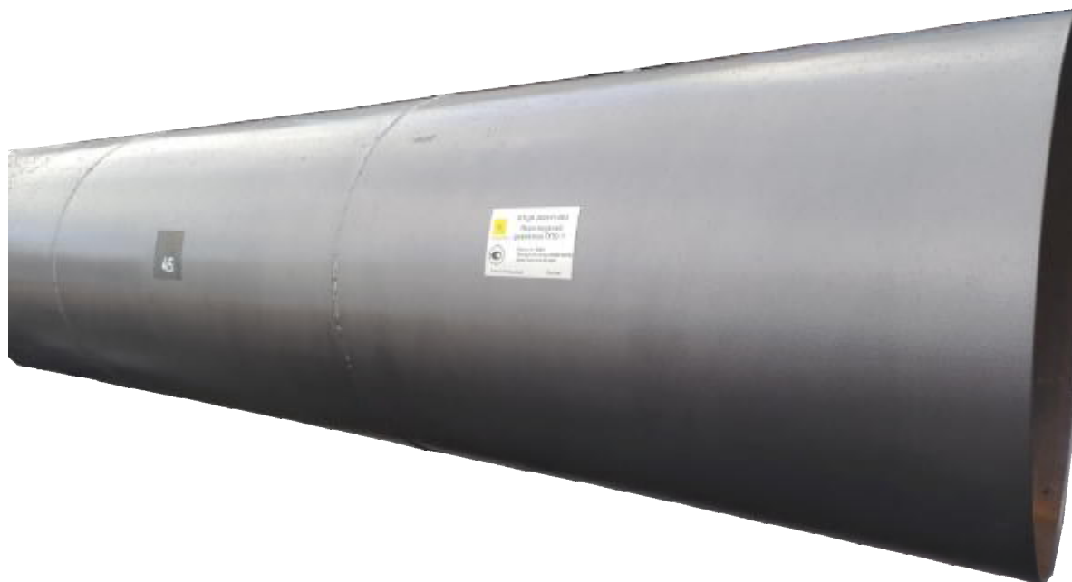
Рисунок 1 – Общий вид меры

Схема расположения дефектов на мере представлена на рисунке 2.