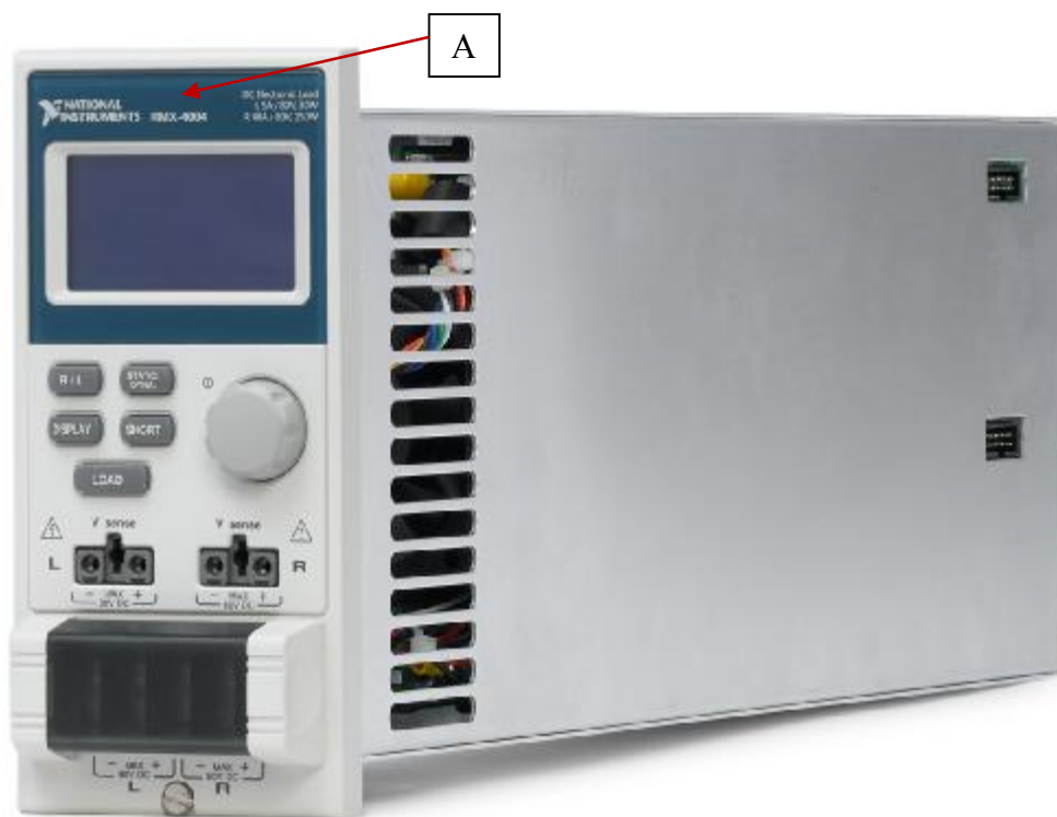
Рисунок 1 – Общий вид нагрузок и схема нанесения знака утверждения типа (А)