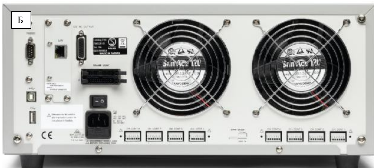
Рисунок 3 – Схема пломбировки от несанкционированного доступа (Б)