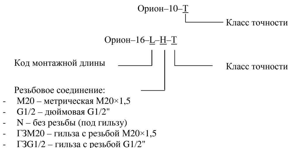
Рисунок 2 – Схема условных обозначений