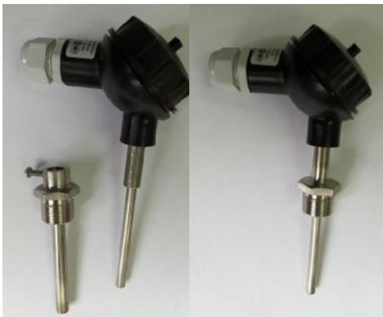
Рисунок 1.2 – Орион-16