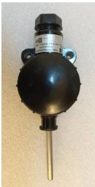
Рисунок 1.1 – Орион-10

Общий вид термопреобразователей с унифицированным выходным сигналом Орион-10, Орион-16 представлен на рисунке 1.