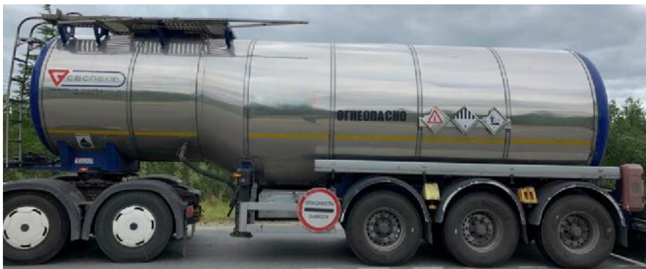
Рисунок 1 - Общий вид полуприцепа-цистерны SF3B28

Схема пломбировки для защиты от несанкционированного изменения положения указателя уровня налива, обозначение мест нанесения знака поверки представлены на рисунке 2.