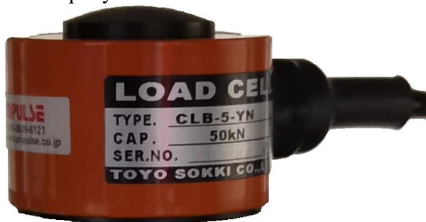
Рисунок 1 – Общий вид датчиков силоизмерительных тензорезисторных CLB-5-YN

Общий вид датчиков представлен на рисунке 1.