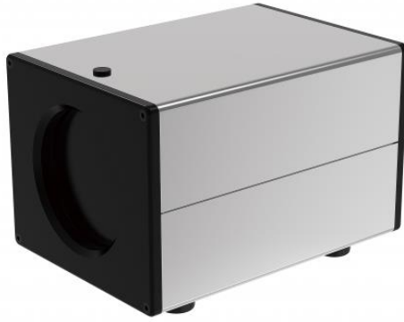
Рисунок 6 – Общий вид АЧТ