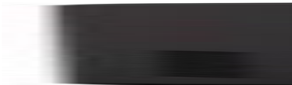
Рисунок 1 – Общий вид терминала, входящего в состав комплексов серии DS-M модели DS-MDN005-B

Фотографии общего вида компонентов комплексов измерительных тепловизионного контроля стационарных серий DS-K, DS-M приведены на рисунках 1-5. Структура системы представлена на рисунке 6.