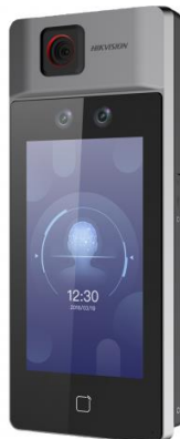
Рисунок 3 – Общий вид терминала, входящего в состав серии DS-K модели DS-K1T671TM-3XF