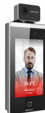
Рисунок 4 – Общий вид терминала, входящего в состав серии DS-K модели DS-K1TA70MI-T