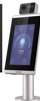
Рисунок 2 – Общий вид терминала, входящего в состав комплексов серии DS-K модели DS-K5671-3XF/ZU