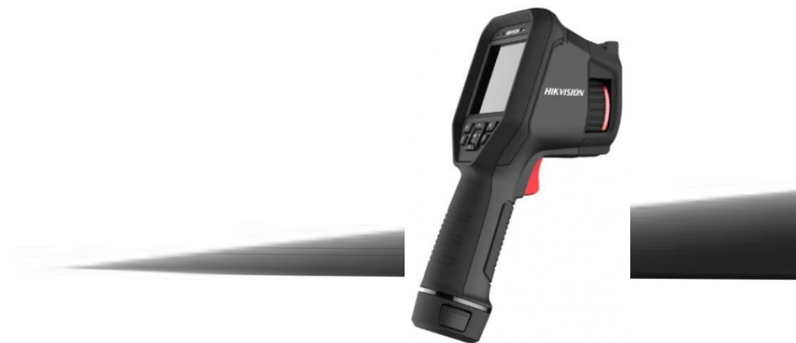
Рисунок 1 – Общий вид тепловизора, входящего в состав комплексов модели DS-2TP31B-3AUF