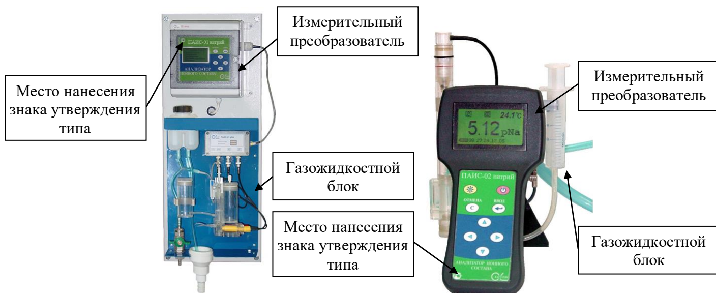
Рисунок 1 – Общий вид анализатора модификации ПАИС-01натрий