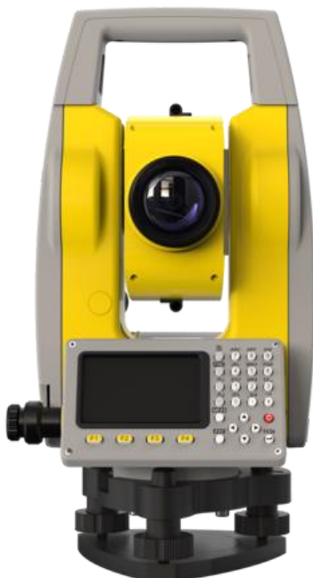
Рисунок 1 – Общий вид тахеометров электронных GeoMax Zoom10

Общий вид тахеометров электронных представлен на рисунке 1. Общий вид маркировочной таблички представлен на рисунке 2.