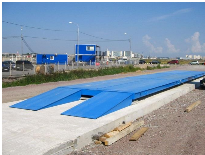
Рисунок 2 – Общий вид ГПУ весов