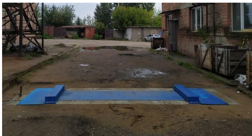
Рисунок 1 – Общий вид ГПУ весов