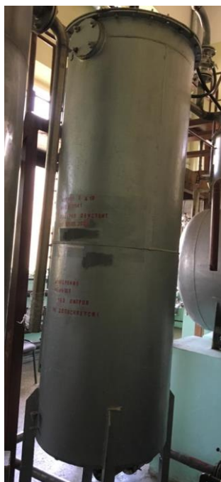
Рисунок 1 - Общий вид мерника К7-ВМА, зав.№ 4758