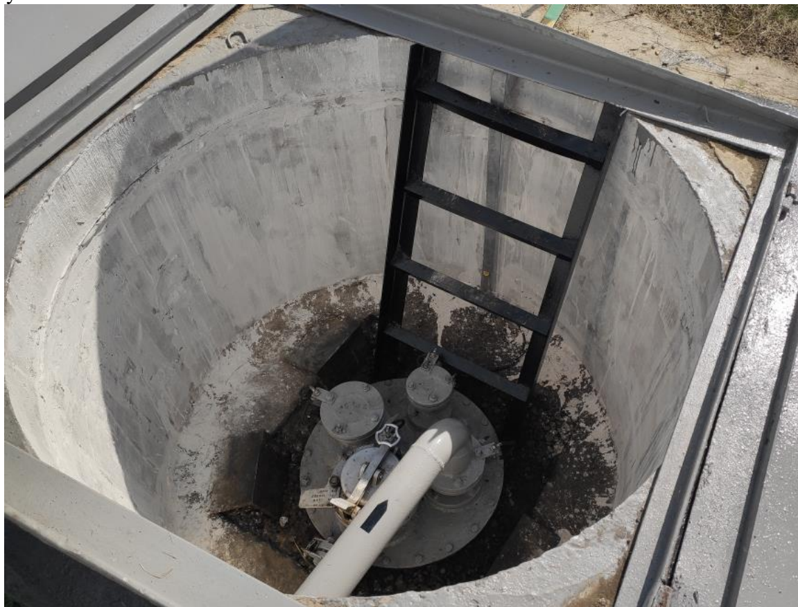
Рисунок 1 – Общий вид резервуаров

Общий вид резервуаров представлен на рисунке 1. Эскиз резервуаров представлен на рисунке 2.