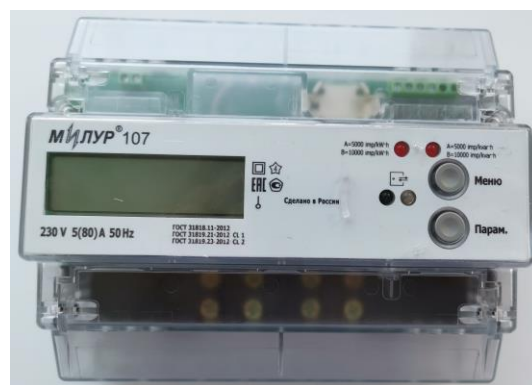
б) счетчики в корпусе 9МТН35