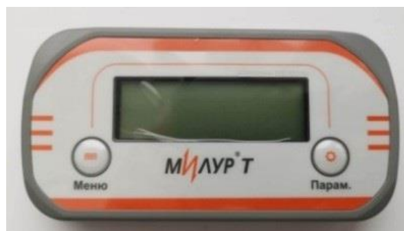
в) счетчики в корпусе SPLIT (наружная установка)