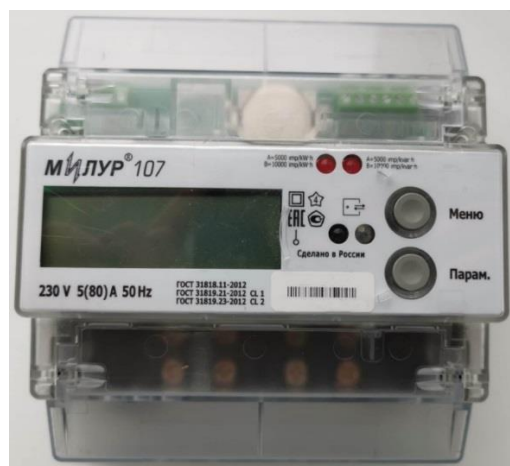
а) счетчики в корпусе 7МТН35