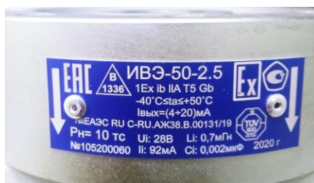
Рисунок 2 Общий вид маркировочной таблички

Пломбировка датчиков от несанкционированного доступа не предусмотрена.