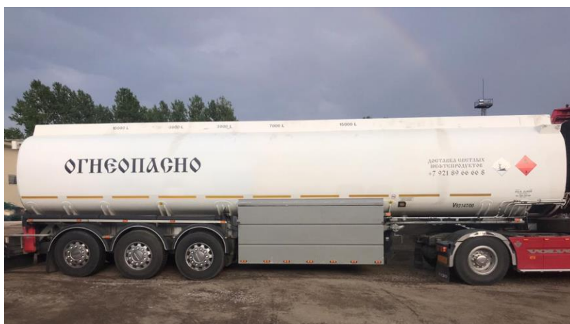
Рисунок 1 – Общий вид полуприцепа-цистерны LAG 0-3-39T

Общий вид полуприцепа-цистерны LAG 0-3-39T зав.№ YB4L0223390109891 представлен на рисунках 1-2.