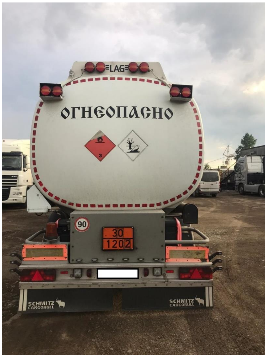
Рисунок 2 – Общий вид полуприцепа-цистерны LAG 0-3-39T

Схема пломбировки для защиты от несанкционированного изменения положения уровня налива, обозначение места нанесения знака поверки представлены на рисунке 3.