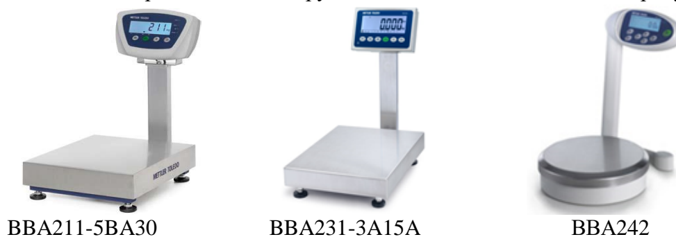
Рисунок 1 - Весы с терминалом, установленным на стойке, закрепленной на основании корпуса весов