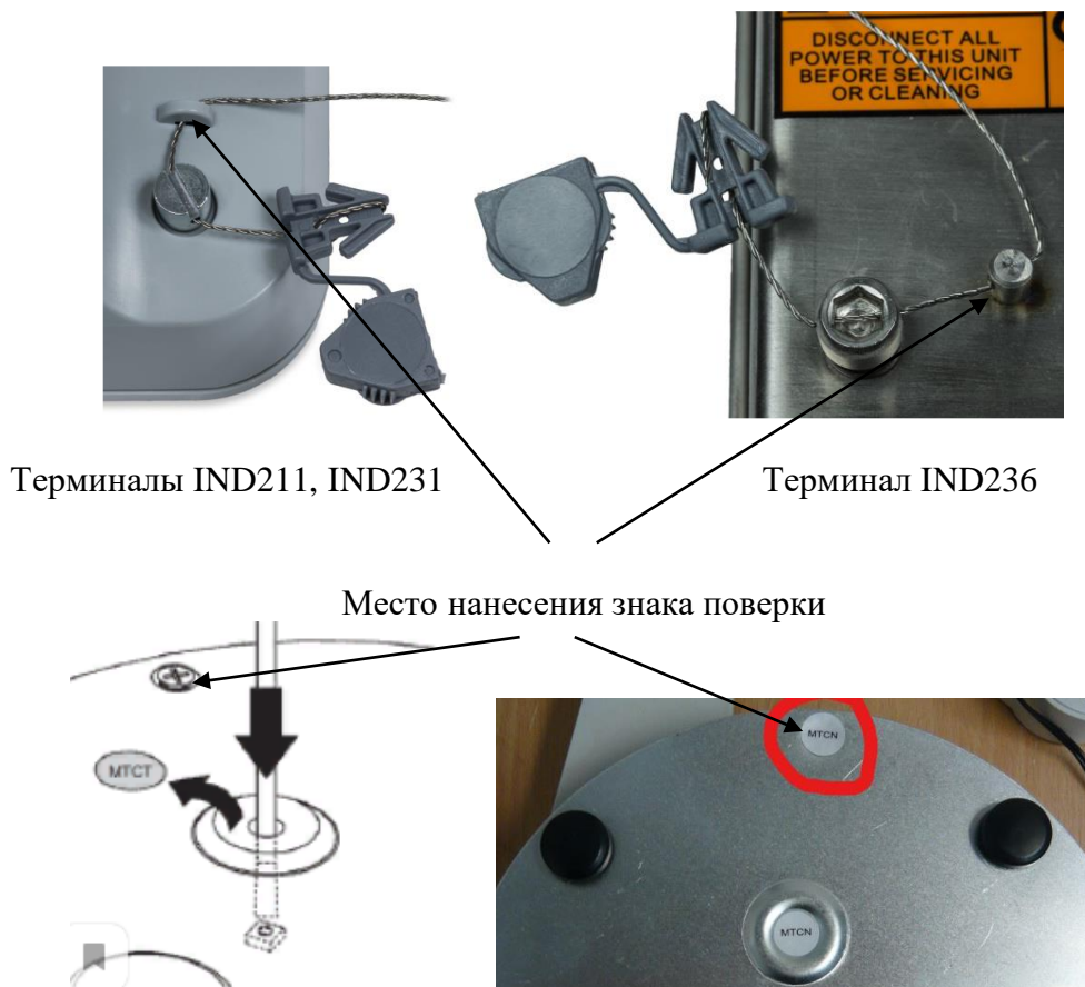
Рисунок 4 - Места пломбировки корпусов терминалов и модификации весов ВВА242

Защита от несанкционированного доступа к настройкам и данным измерений обеспечивается защитной пломбой, которая находится на нижней или на боковой поверхности терминалов IND211, IND231 и IND236, как показано на рисунке 4. Место пломбировки модификация весов ВВА242 находится под грузоприемной платформой. При поступлении от изготовителя закрыто наклейкой МТСТ или МТСН, как показано на рисунке 4.