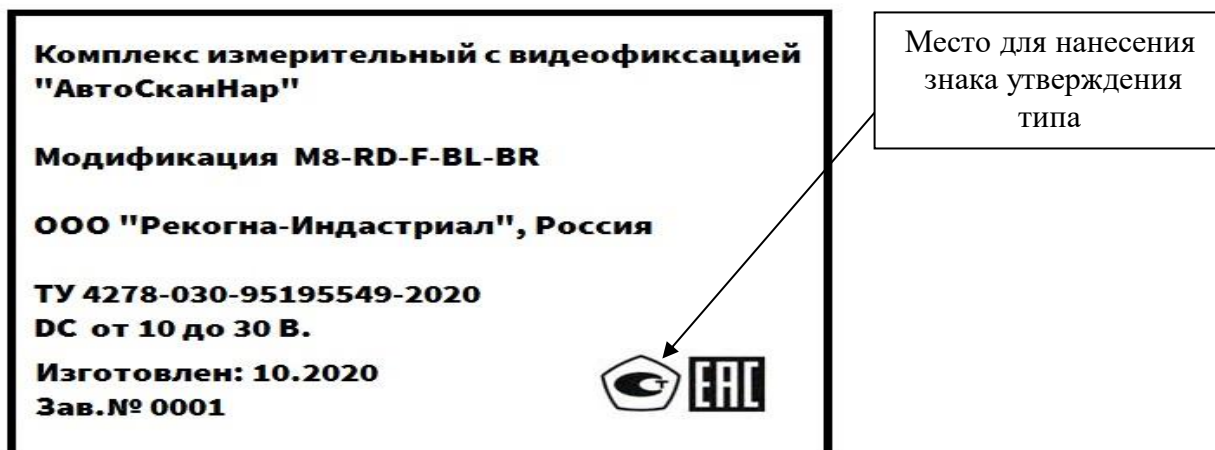
Рисунок 3 – Пример маркировки комплексов и обозначение места нанесения знака утверждения типа

Нанесение знака поверки на средство измерений не предусмотрено.