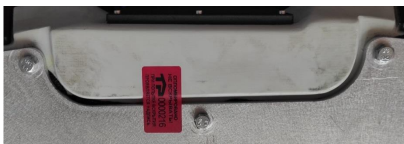
Рисунок 2 – Схема пломбировки от несанкционированного доступа

Маркировка наносится на этикетку, расположенную на корпусе комплексов. Пример маркировки комплексов и обозначение места нанесения знака утверждения типа представлены на рисунке 3.