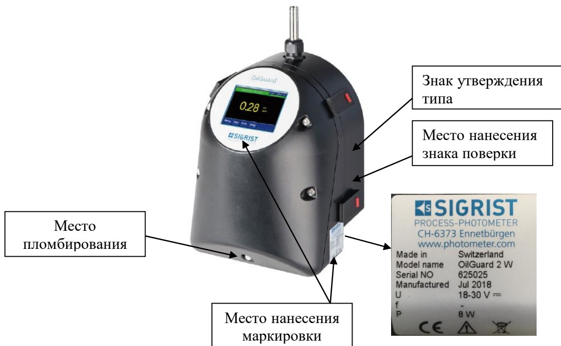
Рисунок 1 - Анализаторы OilGuard 2W