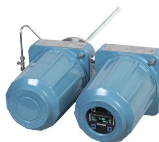
Рисунок 4 – Общий вид газоанализаторов интегрального монтажа с локальным интерфейсом оператора LOI