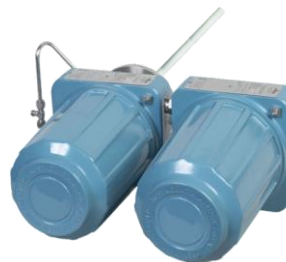
Рисунок 2 – Общий вид газоанализаторов интегрального монтажа без локального интерфейса оператора LOI