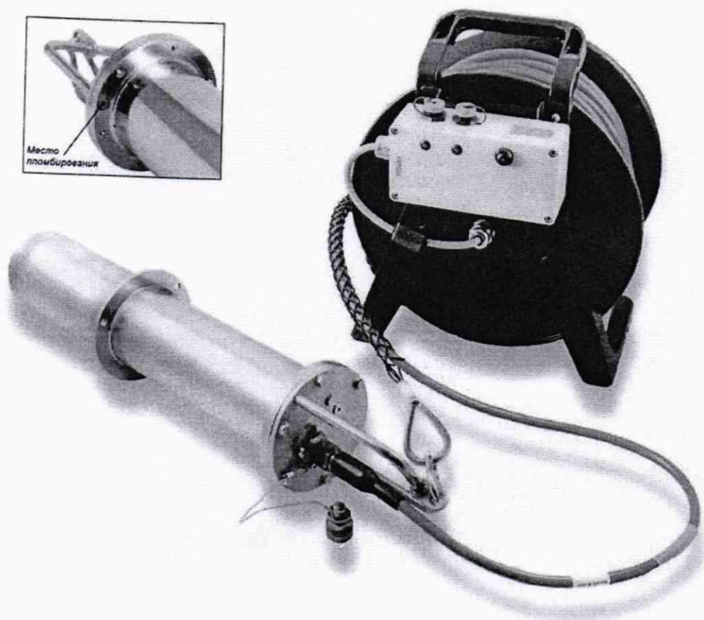
Рисунок 1 – Внешний вид спектрометров

Внешний вид спектрометров приведен на рисунке 1.