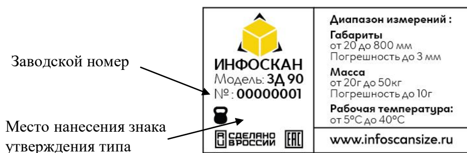
Рисунок 3 – Пример идентификационной таблички устройств

Для ограничения доступа в целях несанкционированной настройки или вмешательства производится пломбирование задней и передней панелей корпуса блока обработки и отображения информации посредством установки разрушающихся пломб-наклеек. Место пломбирования показано стрелками на рисунке 4.