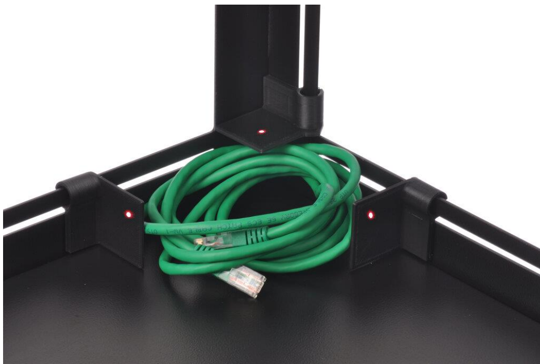
Рисунок 2 – Пример измерения габаритных размеров объекта неправильной формы