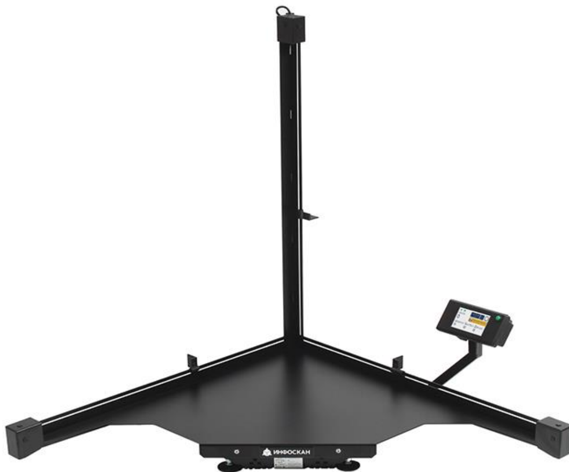
Рисунок 1 – Общий вид устройств

Маркировка устройств, в том числе нанесение заводского номера, производится путём наклеивания идентификационной таблички на переднюю панель весовой платформы. Пример идентификационной таблички представлен на рисунке 3.