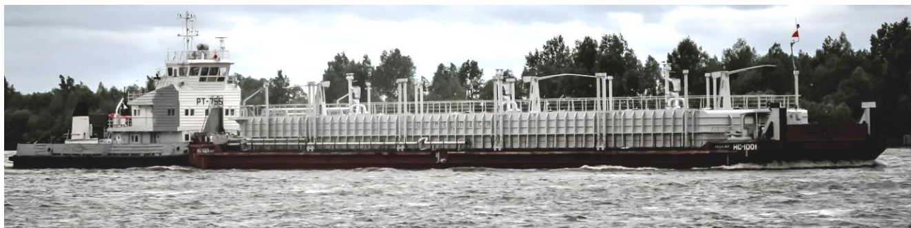
Рисунок 1 – Общий вид нефтеналивной баржи HC-1001