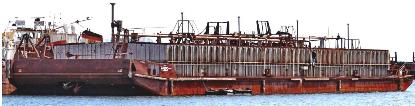
Рисунок 1 – Общий вид нефтеналивной баржи Н-905