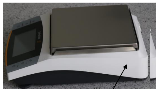
Рисунок 10 – Место пломбирования весов от несанкционированного доступа