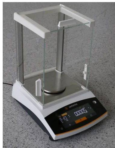
Рисунок 4 – Общий вид весов BCE с d = 0,1 мг BCE224I-1ORU; BCE124I-1ORU; BCE64I-1ORU