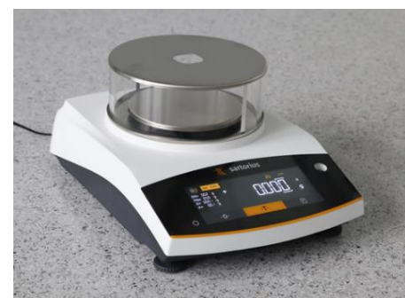
Рисунок 5 – Общий вид весов ВСА с d = 1 мг BCA1203I-1ORU; BCA623I-1ORU; BCE623I-1ORU; BCE423I-1ORU; BCA423I-1ORU; BCA323I-1ORU; BCE323I-1ORU; BCE223I-1ORU BCA223I-1ORU Рисунок 6 – Общий вид весов BCE с d = 1 мг Рисунок 7 – Общий вид весов BCE с d = 1 мг BCE653I-1ORU