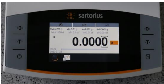
Рисунок 1 – Общий вид модуля терминала BSA

Общий вид модулей терминала и весов представлен на рисунках 1 – 9.