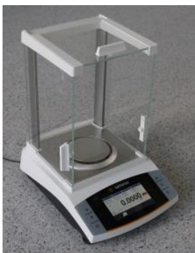
Рисунок 3 – Общий вид весов BSA с d = 0,1 мг BSA324I-1ORU; BSA224I-1ORU; BSA124I-1ORU; BSA64I-1ORU