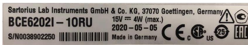
Рисунок 12 –Табличка с модификацией весов

Маркировка весов приведена на рисунках 12 и 13. Серийный номер и буквенно-цифровое обозначение модификации приведено на маркировочной табличке в виде наклейки, расположенной на задней стенке корпуса весов; табличка в виде наклейки с метрологическими характеристиками на боковой стенке корпуса весов.