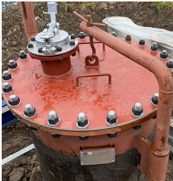
Рисунок 2 – Горловины и замерной люк резервуара стального горизонтального цилиндрического РГС-12,5.

Горловины и замерной люк резервуара стального горизонтального цилиндрического РГС-12,5 представлены на рисунке 2.