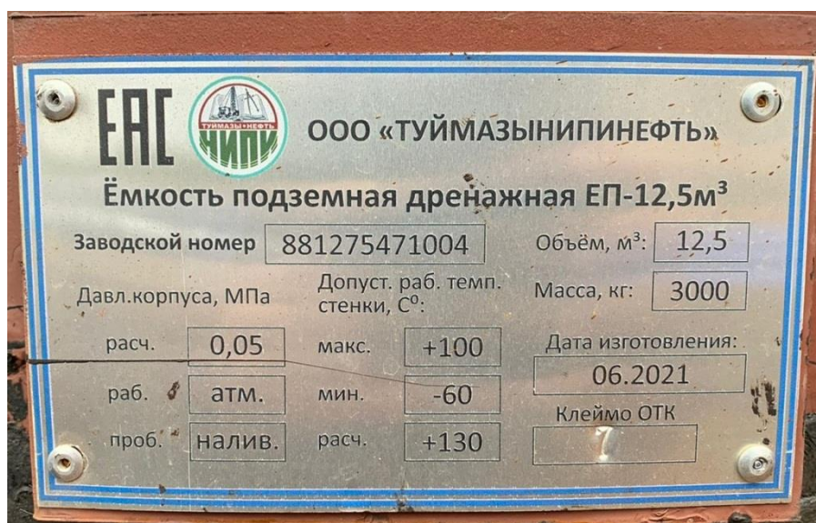
Рисунок 3 – Заводской номер резервуара стального горизонтального цилиндрического РГС-12,5.

Заводской номер резервуара стального горизонтального цилиндрического РГС-12,5 представлен на рисунке 3.