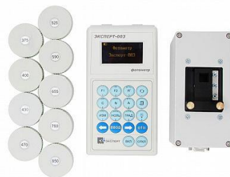
Рисунок 6 – Фотометр Эксперт-003