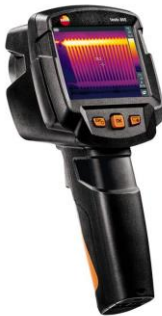
Рисунок 5 – Тепловизор инфракрасный Testo 872