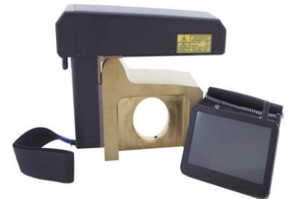
Рисунок 4 – Профилометр поверхности катания колесной пары ИКП