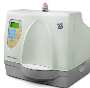
Рисунок 10 – Аппарат рентгеновский для спектрального анализа СПЕКТРОСКАН МАКС-GF