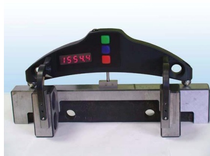
Рисунок 3 – Скоба измерительная диаметров колесных пар ИДК