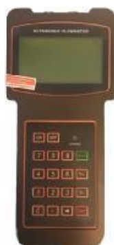
Рисунок 9 – Расходомер-счетчик ультразвуковой Стримлюкс (Streamlux) SLS-720P