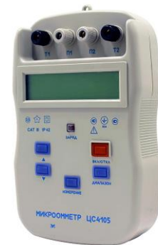
Рисунок 7 – Микроамметр ЦС4105