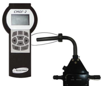
Рисунок 8 – Дымомер СМОГ-2