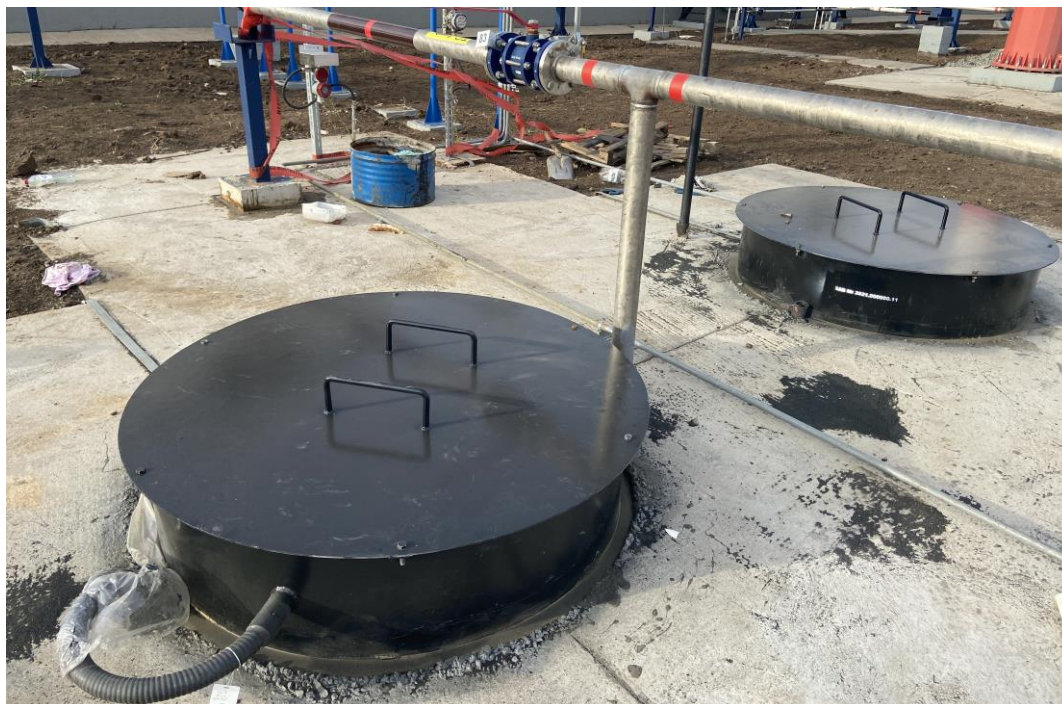
Рисунок 2 – Общий вид резервуара РГС-50