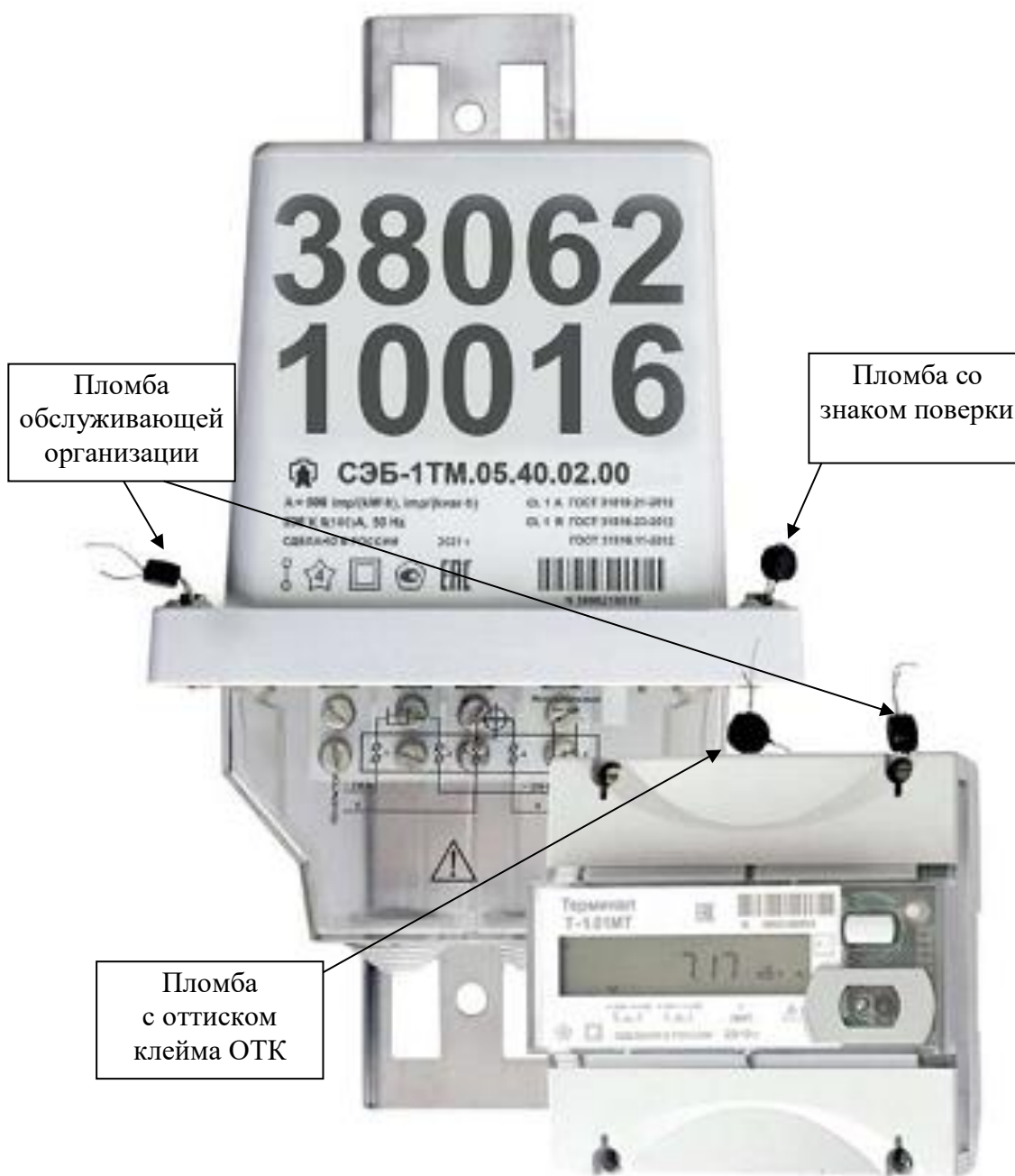
Рисунок 3 – Общий вид счетчика наружной установки, схема пломбировки от несанкционированного доступа, обозначение места нанесения знака поверки