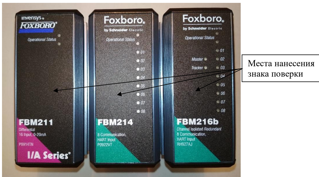
Рисунок 1 Модули Fieldbus (FBM), монтируемые на DIN - рейку

На рисунке 2 приведён вид на шкаф управления системы в сборе и указано место расположения таблички с указанием полного наименования системы и заводского номера.