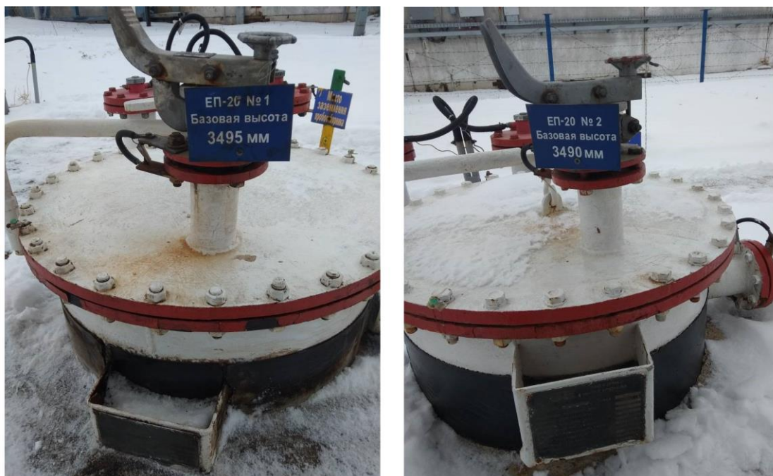
Рисунок 2 – Общий вид резервуаров РГС-20