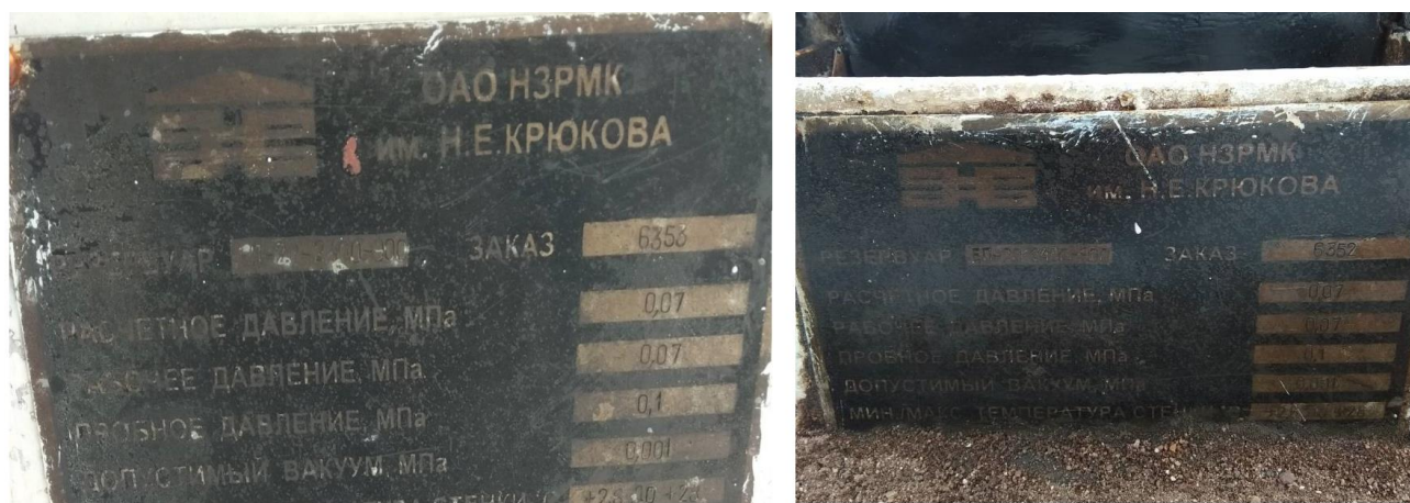
Рисунок 1 – Место нанесения заводских номеров

Нанесение знака поверки на средство измерений не предусмотрено.