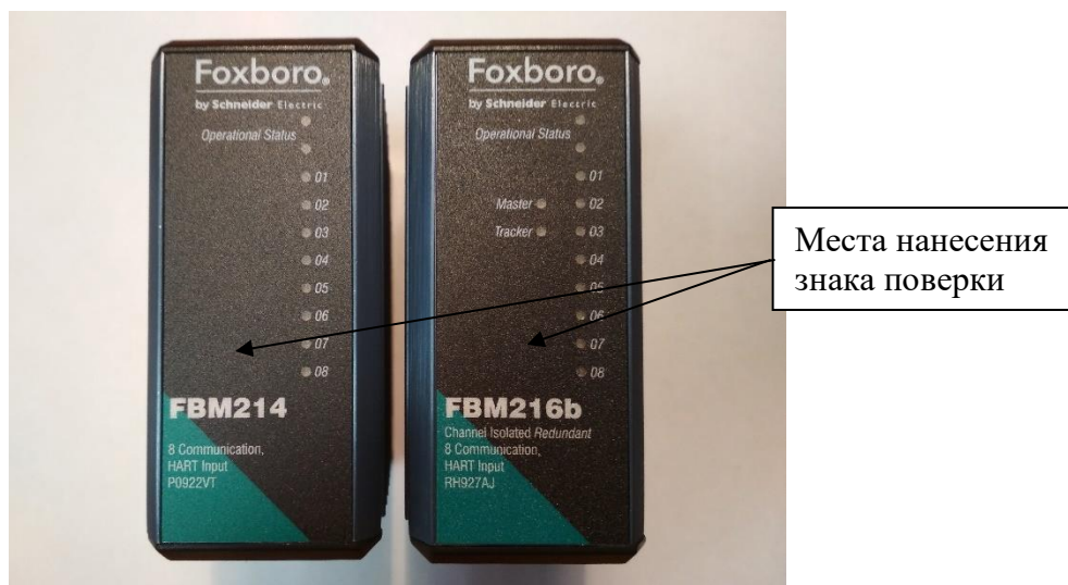
Рисунок 1 Модули Fieldbus (FBM), монтируемые на DIN - рейку

На рисунке 2 приведён вид на шкаф управления системы в сборе и указано место расположения таблички с указанием полного наименования системы и заводского номера.