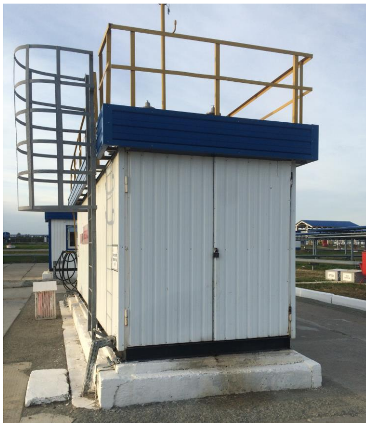
Рисунок 2 – Общий вид резервуаров РГС-10