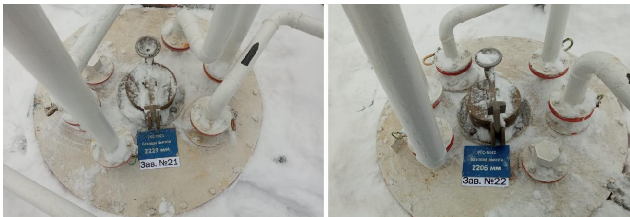
Рисунок 1 – Место нанесения заводских номеров

Нанесение знака поверки на средство измерений не предусмотрено.