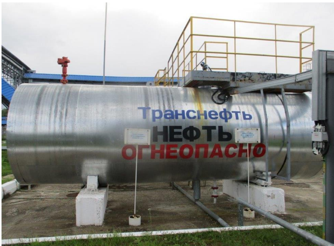
Рисунок 2 – Общий вид резервуара РГС-20 с заводским номером 6