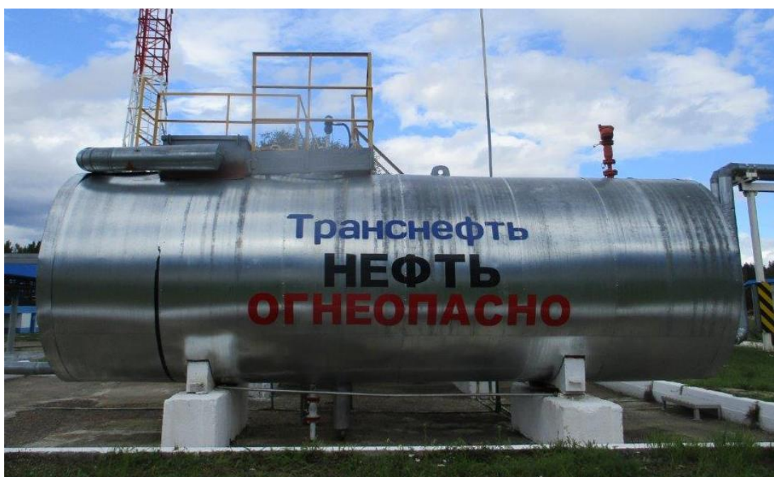
Рисунок 3 – Общий вид резервуара РГС-20 с заводским номером 9

Пломбирование резервуаров РГС-20 не предусмотрено.