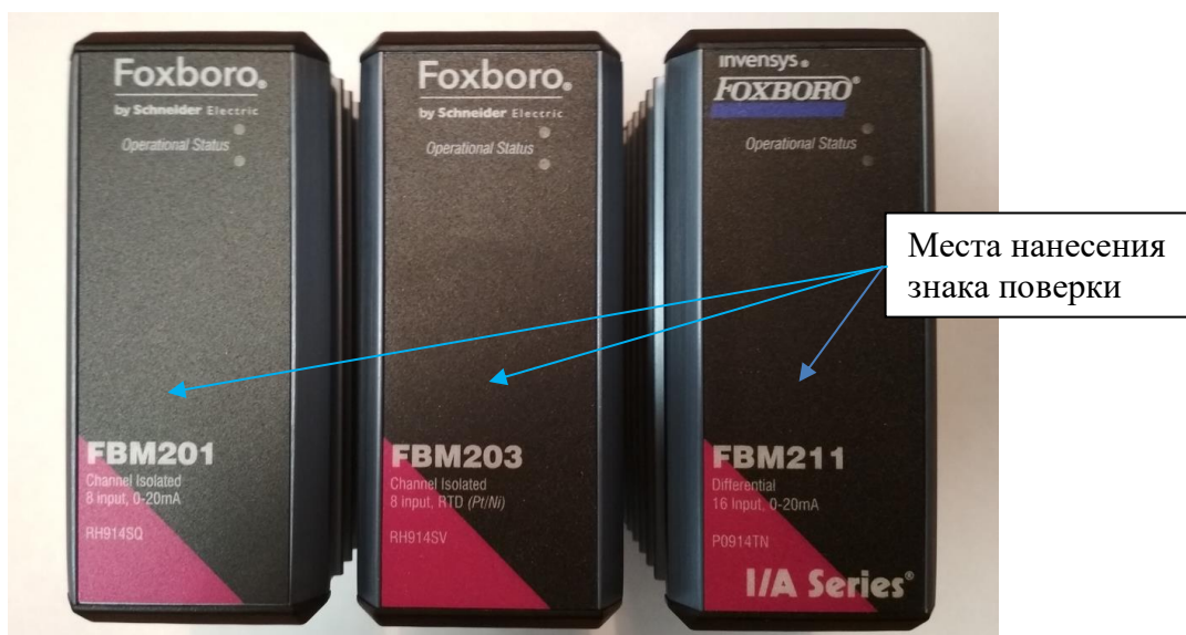
Рисунок 1 Модули Fieldbus (FBM), монтируемые на DIN - рейку

На рис. 1 приведён внешний вид измерительных модулей FBM.