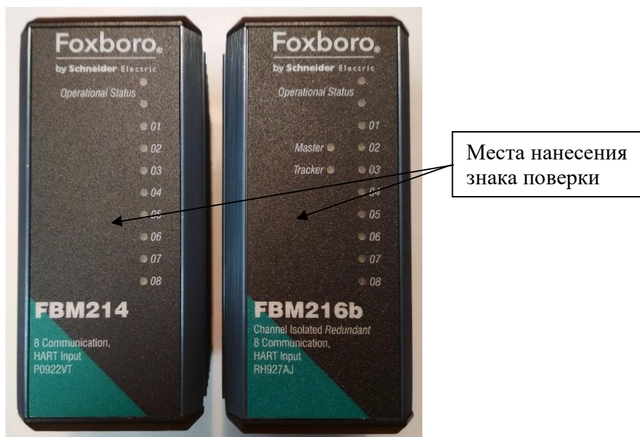
Рисунок 1 – Модули Fieldbus (FBM), монтируемые на DIN - рейку

На рисунке 2 приведён вид на шкаф управления системы в сборе и указано место расположения таблички с указанием полного наименования системы и заводского номера.