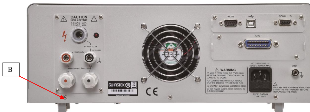
Рисунок 4 – Вид задней панели модификаций GPT-715004, место пломбировки от несанкционированного доступа (В)