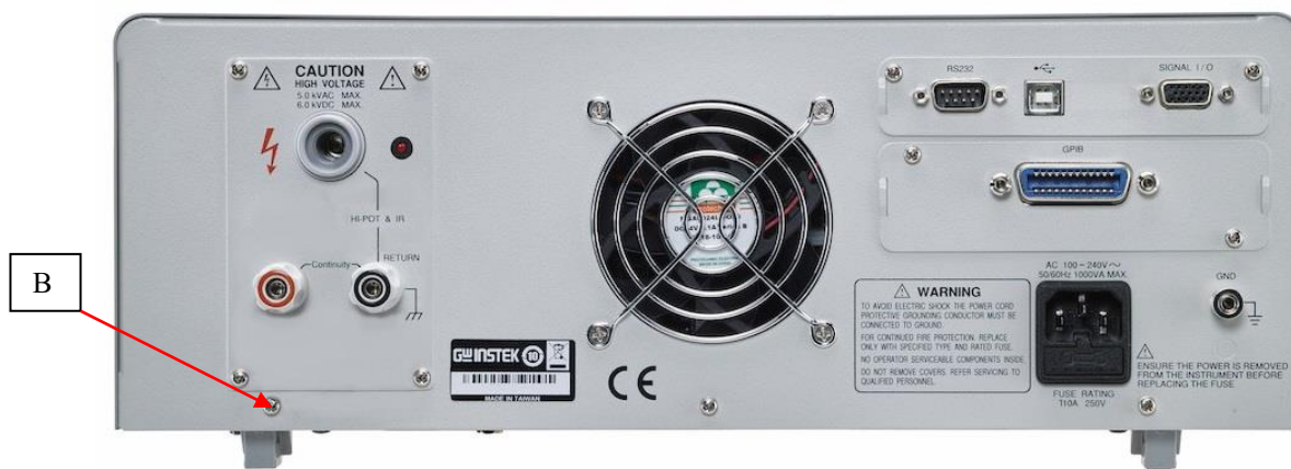
Рисунок 2 – Вид задней панели установок модификаций GPT-715001, GPT-715002, GPT-715003, место пломбировки от несанкционированного доступа (В)