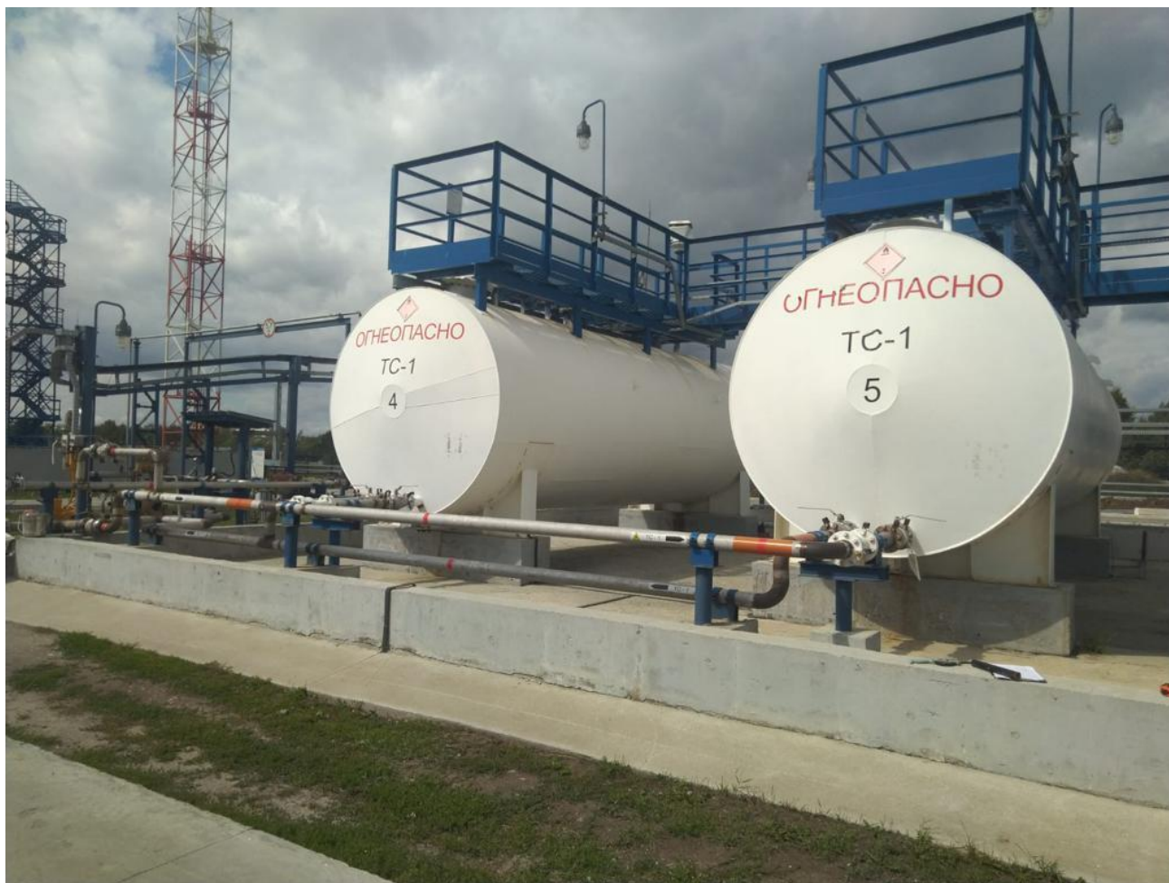
Рисунок 2 – Общий вид резервуаров РГС-50

Пломбирование резервуаров РГС-50 не предусмотрено.