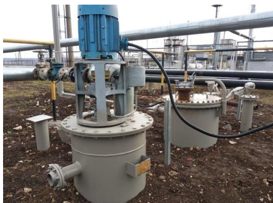
Рисунок 2 – Горловины и замерный люк резервуара стального горизонтального цилиндрического РГС-12,5