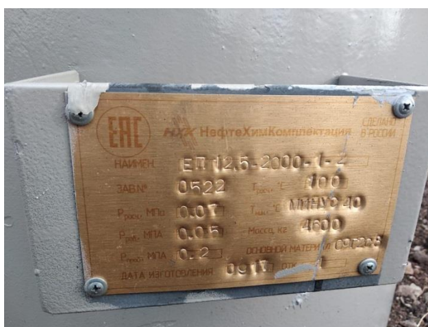
Рисунок 3 – Заводской номер резервуара стального горизонтального цилиндрического РГС-12,5

Пломбирование резервуара стального горизонтального цилиндрического РГС-12,5 не предусмотрено.